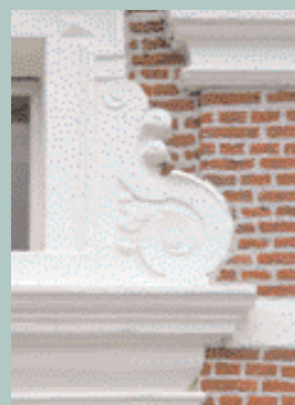
Heerenveen, Gemeenteplein 33 - 37