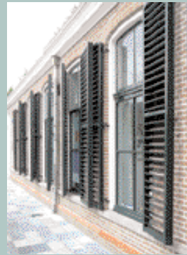
Heerenveen, Gemeenteplein 81 - 83