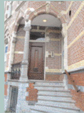
Den Haag, Groot Hertoginnelaan 37 - 39