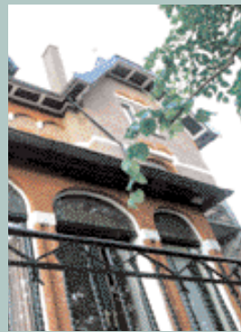
Bussum, Meerweg 7 - 7A