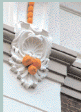
Den Haag, Alexanderstraat 6B - 12