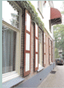
Bilthoven, Soestdijkseweg Zuid 249