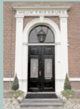
Heerenveen, Burgemeester Falkenaweg 58