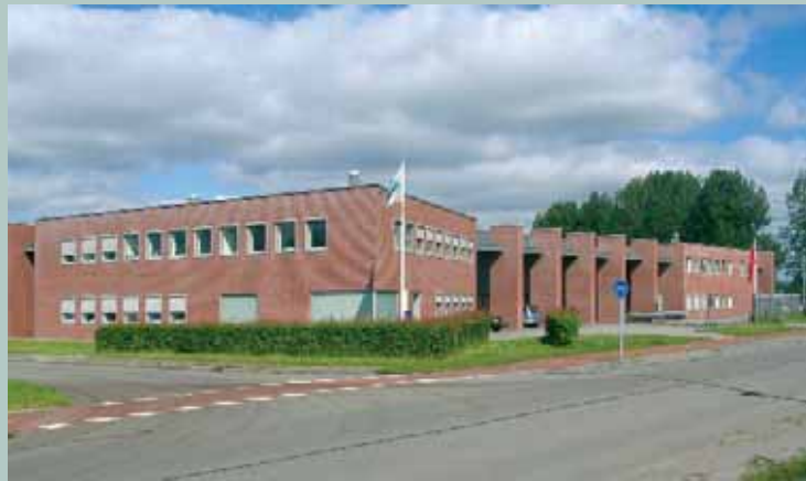
Groningen, Stettinweg 18