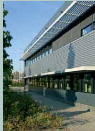
Almere, Transistorstraat 80