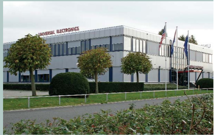
Enschede, Institutenweg 21