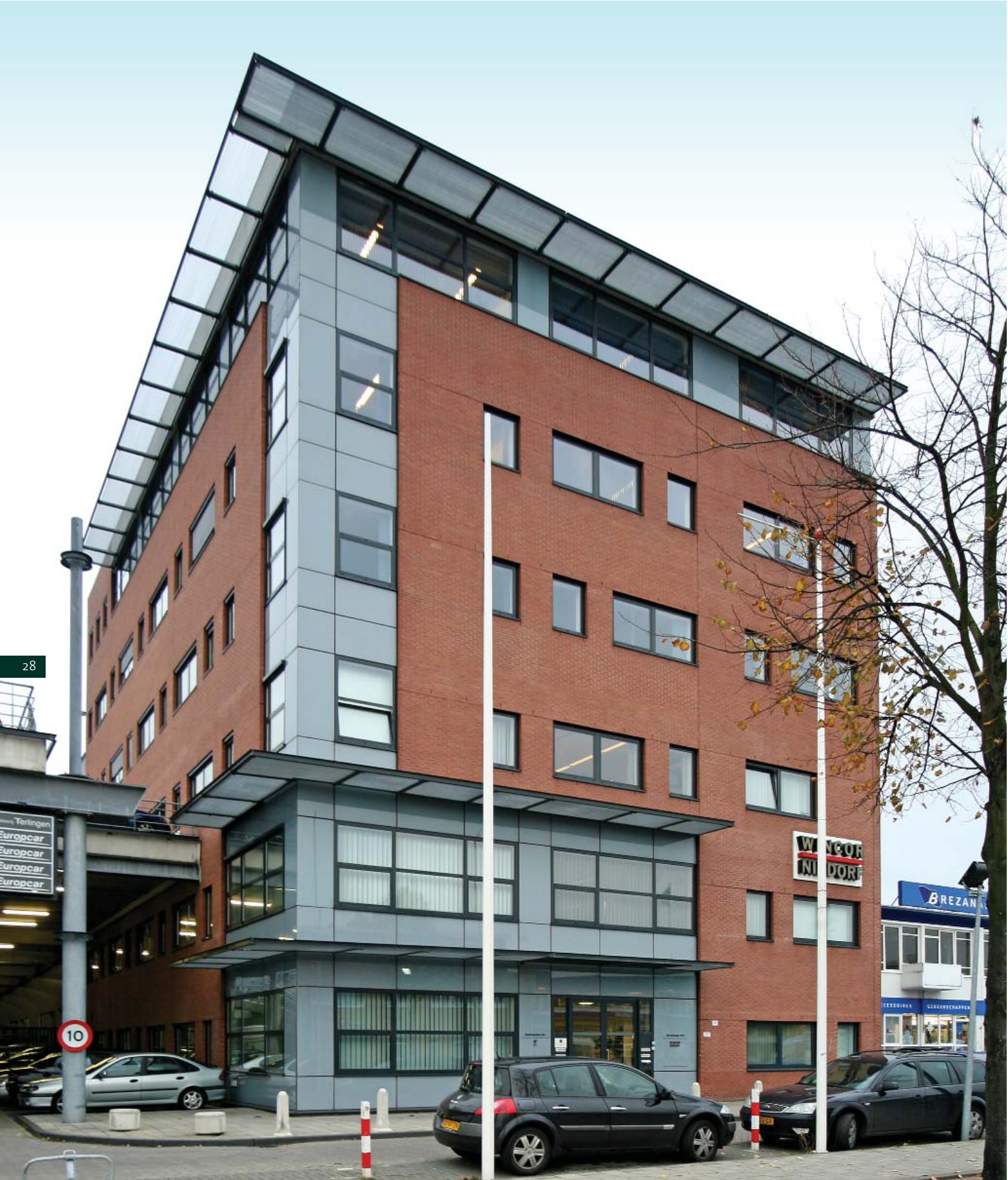
Den Haag, Binckhorstlaan 287-289