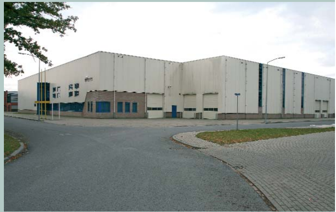
Almelo, Planthofsweg 45